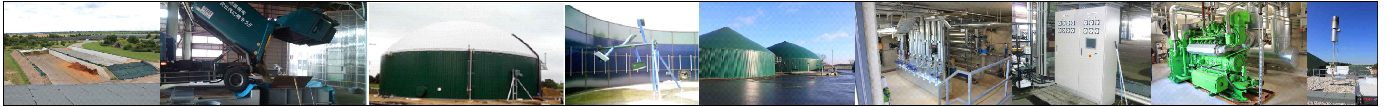
サイレージエリア